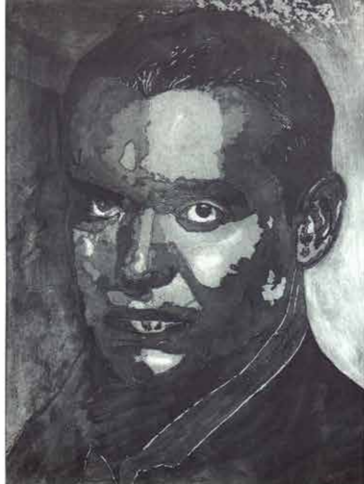
Federico García Lorca